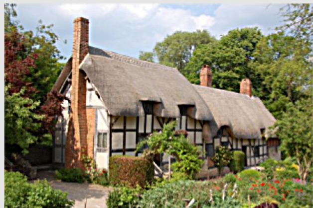
Stratford upon Avon