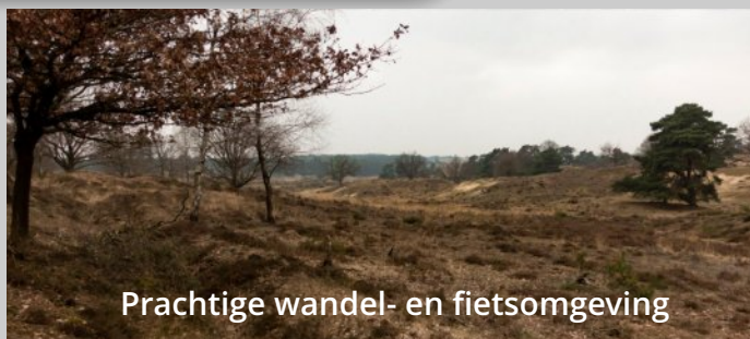
Prachtige wandel- en fietsomgeving