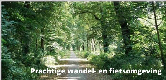
Prachtige wandel- en fietsomgeving