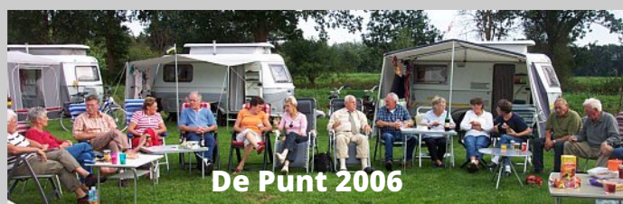
De Punt 2006